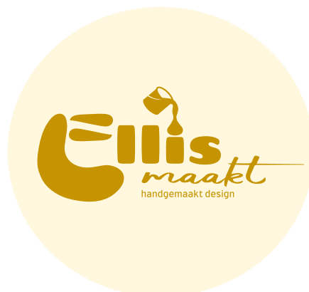
Logo met pay-off