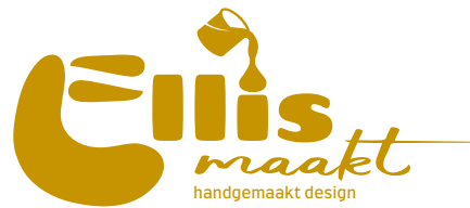
Logo met pay-off