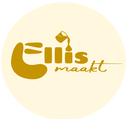
Logo op gekleurde achtergrond