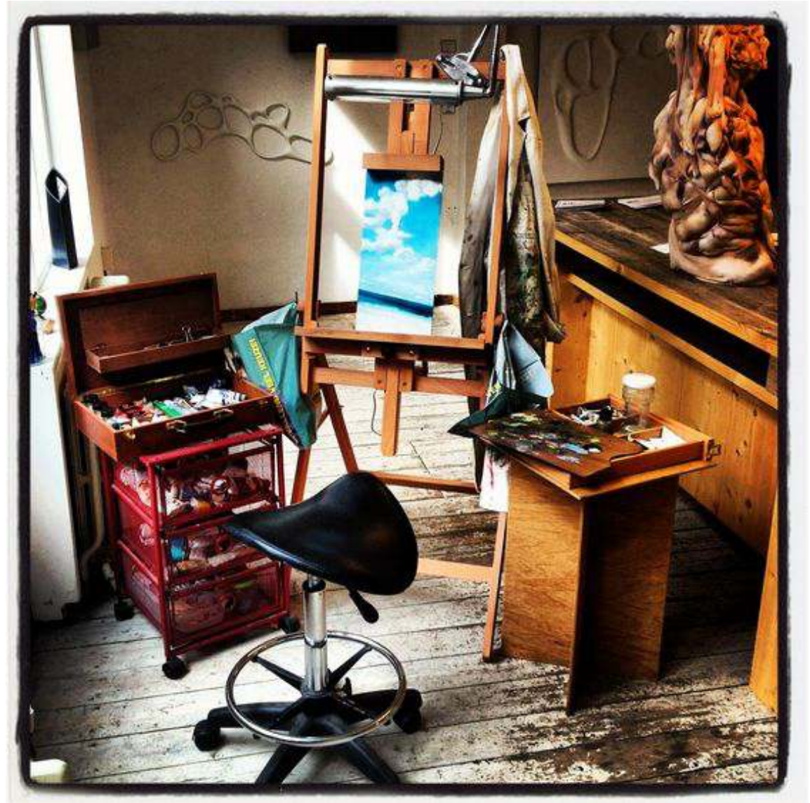
Schilderen in de galerie

En een derde excuus om niet met olieverf te werken die ik vaak hoor is: ik heb er thuis de ruimte niet voor. Je hebt niet per se een atelier nodig of een aparte kamer om te schilderen. Een vierkante meter ergens in huis is al voldoende! Het licht is natuurlijk belangrijk, maar dat kun je met de tips die ik geef makkelijk en goedkoop creëren zodat je een fijne schilderplek hebt waar je rustig weg kunt dwalen van de waan van alledag.